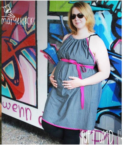
Mary elli ecki

https://www.facebook.com/pages/Knopfloch-mit-Liebe-handgemacht/705692499517048